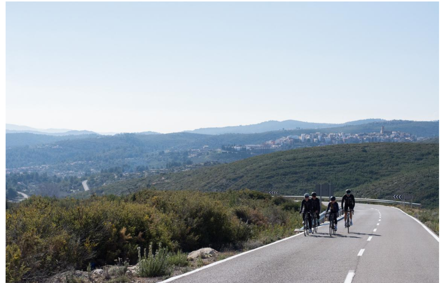
San Juan del Castell: Edificio de interés arquitectónico que data del año 1516 construido con un estilo gótico.